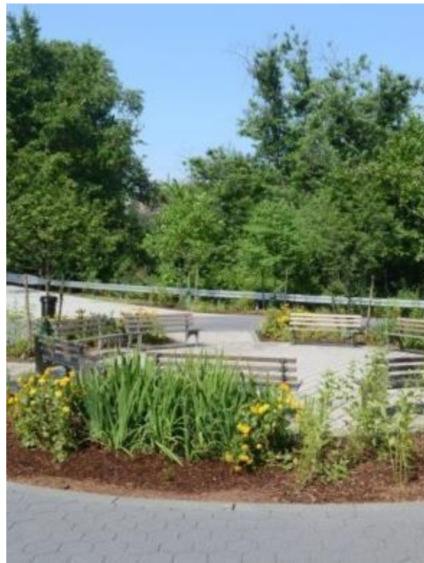
Jardín de Lluvia y Área de Asientos, Shoelace Park